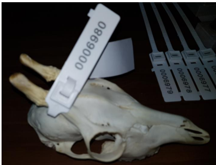
Изглед трофеја са постављеном маркицом